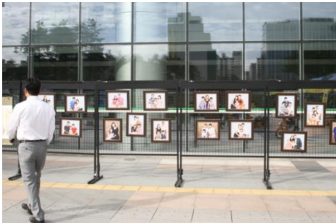
<다문화 가정 가족사진전시>