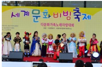
<세계 다문화 패션쇼>