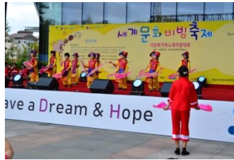
<다문화 무용, 전래놀이 발표>