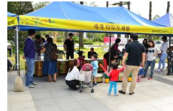
<세계 악기체험 등 체험프로그램>