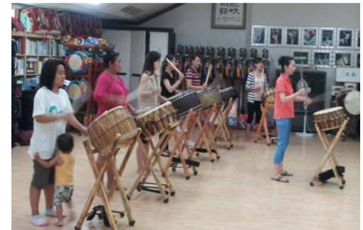
<다문화 이주여성 난타>