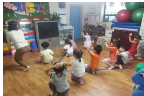
<다문화 나라별 전래놀이>