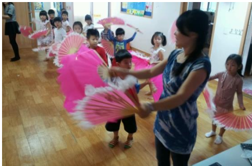
<다문화 어린이 대상 부채춤>